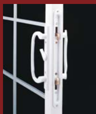
OPTION Poignée Multi-Points