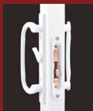
STANDARD Poignée Mortaise